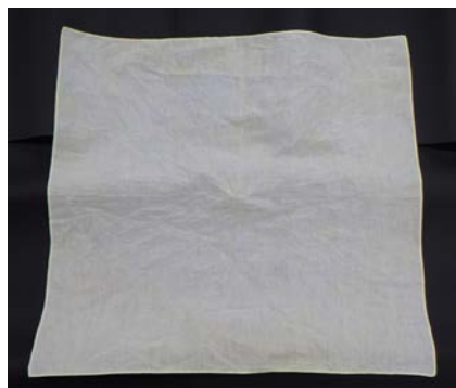
淡い黄色に染まりました！