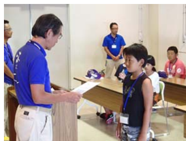
【修了式（修了証授与）】