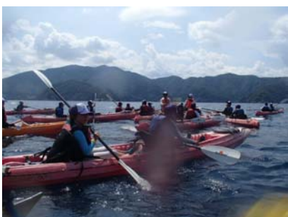
【シーカヤックで無人浜へ】