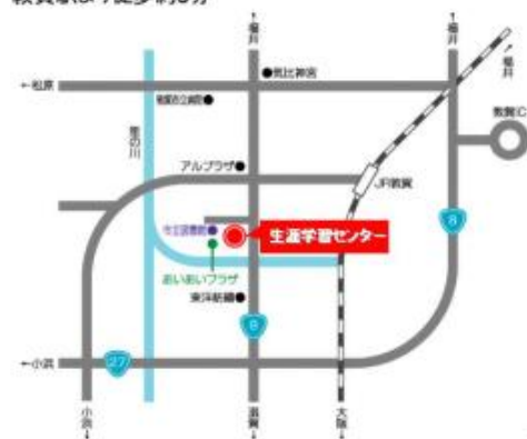
敦賀駅より徒歩約8分