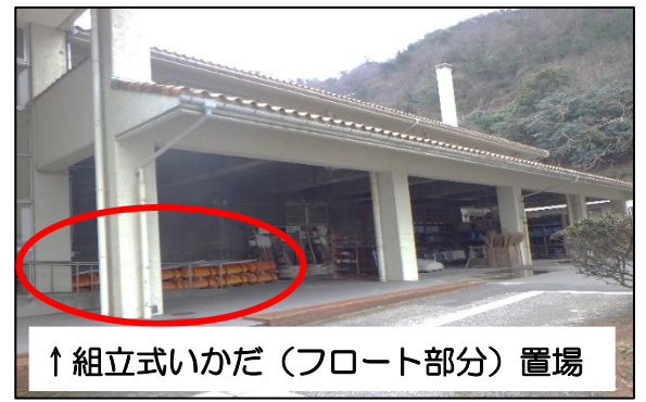
↑組立式いかだ（フロート部分）置場