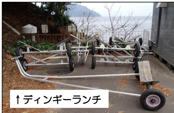
↑ディンギーランチ