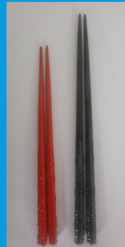
購入時の若狭塗り箸