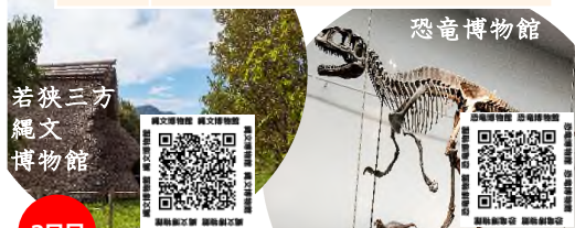
若狭三方 縄文 博物館