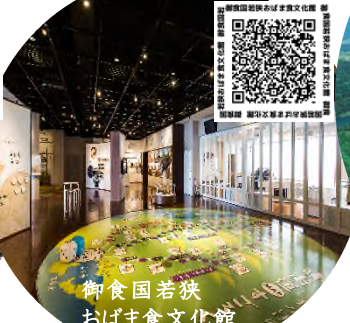
御食国若狭 おばま食文化館