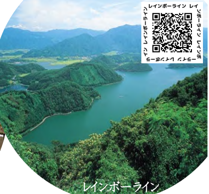
レインボーライン