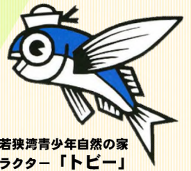
国立若狭湾青少年自然の家 キャラクター「トビー」