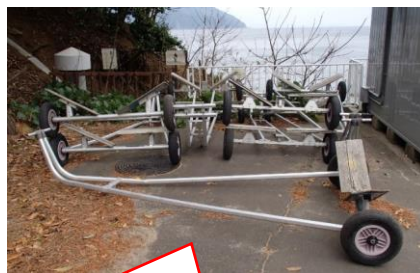
ディンギーランチ (台車)