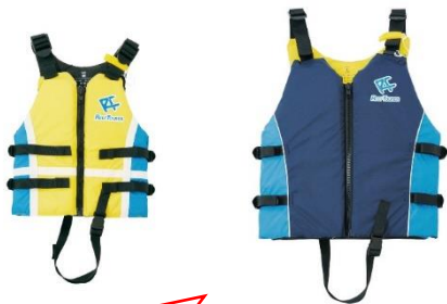
ライフジャケット (左:小、右:大)