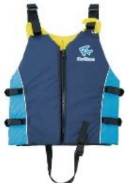
ライフジャケット (左:小, 右:大)