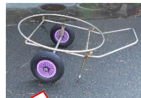
大だらい用 ディンギーランチ(台車)