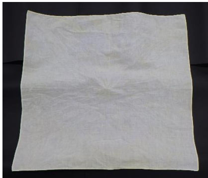
淡い黄色に染まりました！