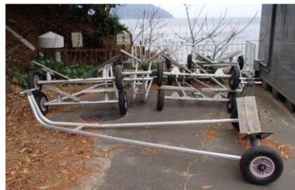
ディングーランチ(台車)