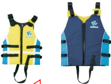
ライフジャケット(左:小、右:大)