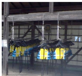
ライフジャケット 【ライフジャケット置場】