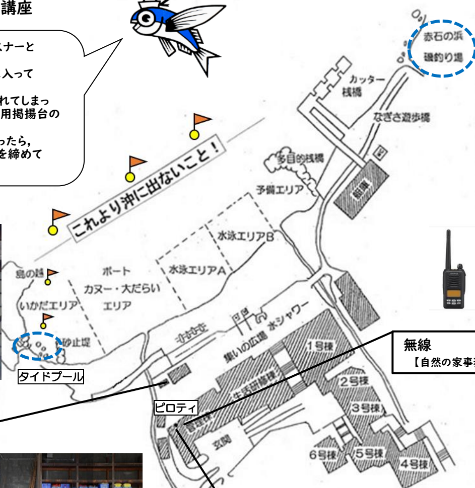
無線 【自然の家事務】