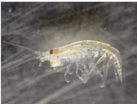
ヨコエビ (拡大サイズ)

み 見つけた いもの 生き物や お 落ち ば 葉の え 絵を か ワークシートに描いてね