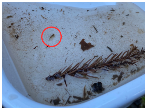
ヨコエビ (実際のサイズ)