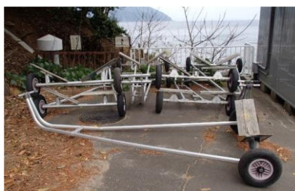
ディングーランチ(台車)