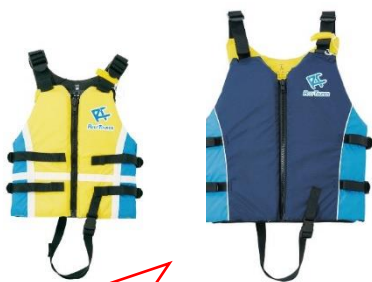
ライフジャケット (左:子ども用、右:大人用)