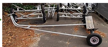
デインギーランチ