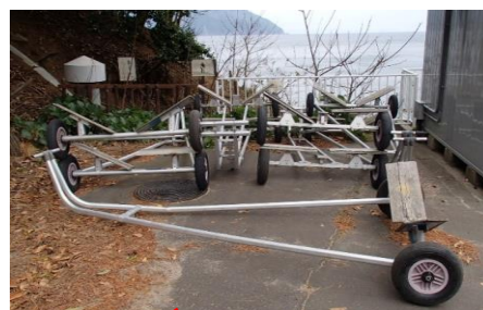
ディングーランチ(台車)