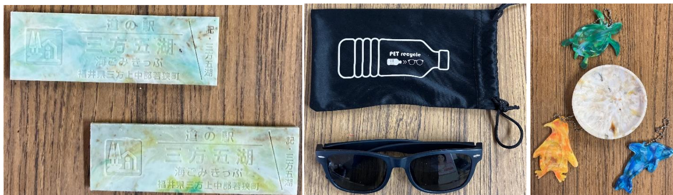
アップサイクル品