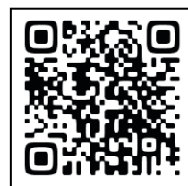
ビーチコーミング 説明資料