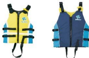
ライフジャケット (左:子ども用、右:大人用)