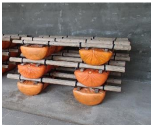
組立式いかだ用フロート