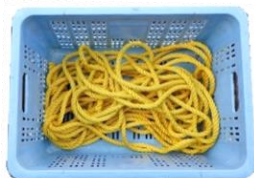
組立式いかだ用ロープ