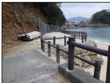
組立式いかだ用丸太