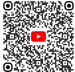
若狭湾 Youtube サイト 「トビーチャンネル」