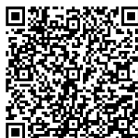
カッター活動実施届 Excel 版