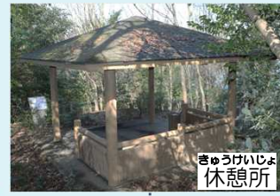
きゅうけいじよ休憩所