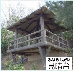
みはらしだい見晴台