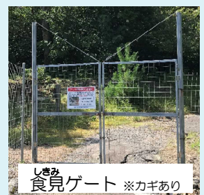
しきみ食見ゲート ※カギあり