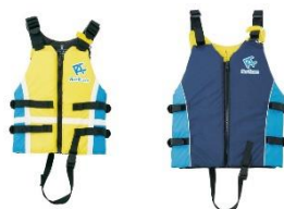
ライフジャケット (左:子ども用、右:大人用)