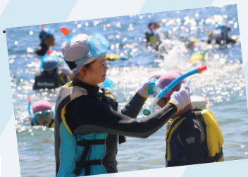
ボランティアとして実際に活動している様子 (R7若狭湾ファミリーデー)