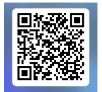
参加申込フォーム