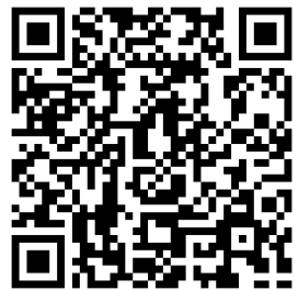
子どもの成長を支える20の体験 リーフレット.PDF ファイル

当事業は「子どもの成長を支える20の体験」（右のQRコードからリーフレットが見られます）をキーワードに保護者や地域の方々が、子どもの生活環境の中に意図的、計画的に多様な体験の機会と場を作るきっかけとなるようなブース展開をしたいと考えています。そのため、右のリーフレットにある「子どもの成長を支える20の体験」のいずれかの「体験ジャンル」に該当する内容での出展（企画・当日運営）をお願いします。